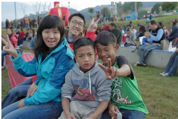
▲ 在草地音樂會中，與當地孩童快樂合影

要電腦，一樣能愉悅地享受生活。然而，另一方面，我也為資源分配不均而感到有些可惜，相同年齡的孩子，他們在都市裡，有的補習、有的常閱讀書籍，或許短時間內不會看出他們的差別，但時間久了，差異會越拉越大。說原住民小孩就是比較調皮不愛念書嗎？但他們又真的享有一般都市小孩所擁有的一切嗎？