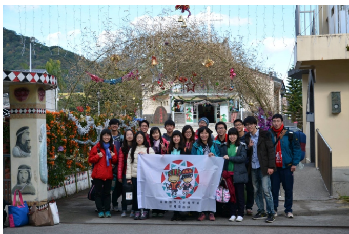
▲ 於天主堂前的合照