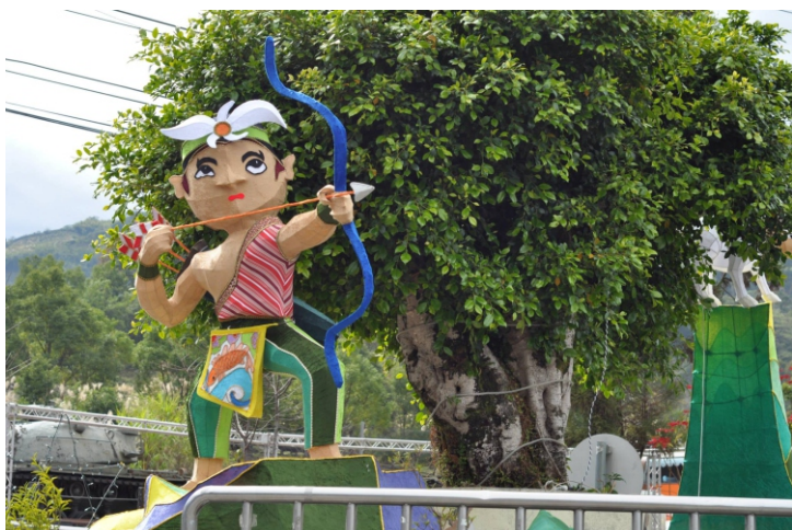
▲ 放在村子入口做為聖誕裝飾的創意燈籠。

一路奔波，根據手機裝置顯示，兩日的行程皆走超過了一萬六千步，包括了對醫師們的探訪、包括了在羅娜這小小村莊的四處奔走。寒流來襲，天很冷、面對案主時只差天色沒暗去半邊。但他們很堅韌，在這嚴寒、在從前的苦難下，依然笑著面對我們這些不速之客的探刺與手忙腳亂。一聲聲的謝謝，實在當之有愧，希望明天正式出對的日子，我們能夠擔起一小部分，體現服務所帶來的價值，而非脫口而出卻毫無意義的“叨擾”。