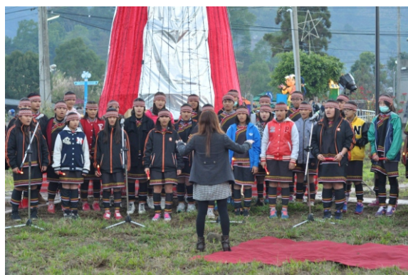
▲ 當地國中生在音樂節上合唱

準備工作之餘，我們也跟隨愚人之友的居家照護員，拜訪當地居民。經過照護員的介紹和簡單的訪問，我了解到當地人的健康問題，其實並不只是肇因於資源和知識的不足，而是包含更多文化與個人的因素。聽完兩位個案道出他們的故事，充滿許多沉重與無奈，單單改善衛教或健康情形，涵蓋的可能只是一小部分。