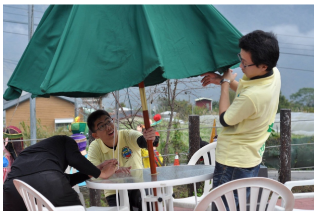
▲ 與村民一同進行音樂會場佈

這次主要都是在拜訪能夠協助我們的校長跟醫師，雖然沒有接觸到小孩子，但是仍然有看到他們在資源不足的環境下玩得很開心，相較於都市的小孩感覺甚麼都有，卻感覺不到他們的開心，另外，部落裡的每個角落似乎都有各種圖案，讓整個部落感覺很有活力，這就讓我更期待能夠和他們做更進一步的認識，希望之後的營隊能夠順利的完成，帶給他們需要的觀念或知識，能夠真正的幫助到他們，也期待能在他們身上學到更多我們所不足的東西，因為在我看起來，他們擁有的可能比我們多了許多。