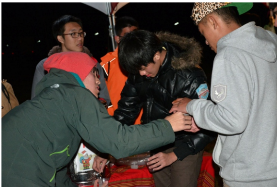
▲ 音樂節中在小米酒攤位幫忙。

上次場勘時，村長告知這兩天剛好有這樣的活動，也歡迎我們來幫忙做活動的布置，因此排入行程，除了架設桌椅，也被安排顧了一個小米酒攤位，和民眾暢飲。藉由這次活動，能感覺和當地的距離更近了一些。