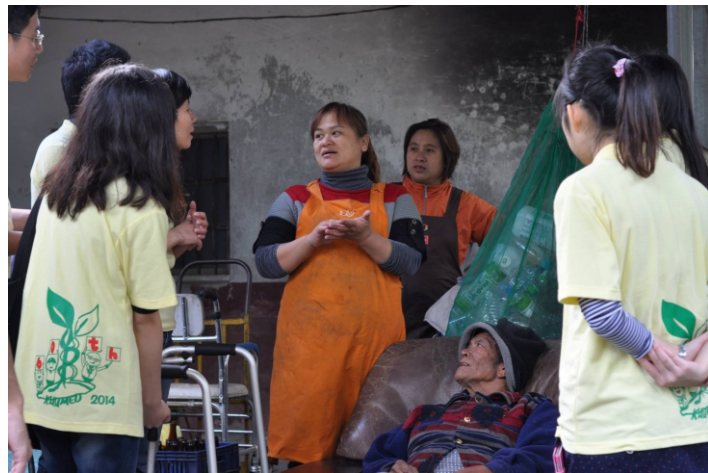
▲ 隨著居家照護員至民眾家中學習

步下巴士，這熟悉的風景，沒錯，過了一年我回到羅娜了，這個讓我初次參與偏鄉服務便收穫滿滿的寶地。沿著羅娜的主要街道而上，看到了許多第一年遇到的小朋友，才過了一年，他們就長大了許多成熟了許多，我們之前教的他們還記得嗎？他們有因為我們教的知識在人生上有一點點不一樣嗎？心中充滿了疑問，趨前與他們攀談，一開始羞赧地躲起來，聊了幾句，他們就又展現出活潑的天性，沒錯，這熟悉的感覺回來了，羅娜的小朋友，就是這麼可愛。這次的接觸，讓我更期待明年寒假出隊會與這群可愛的小朋友們擦出甚麼樣的火花。