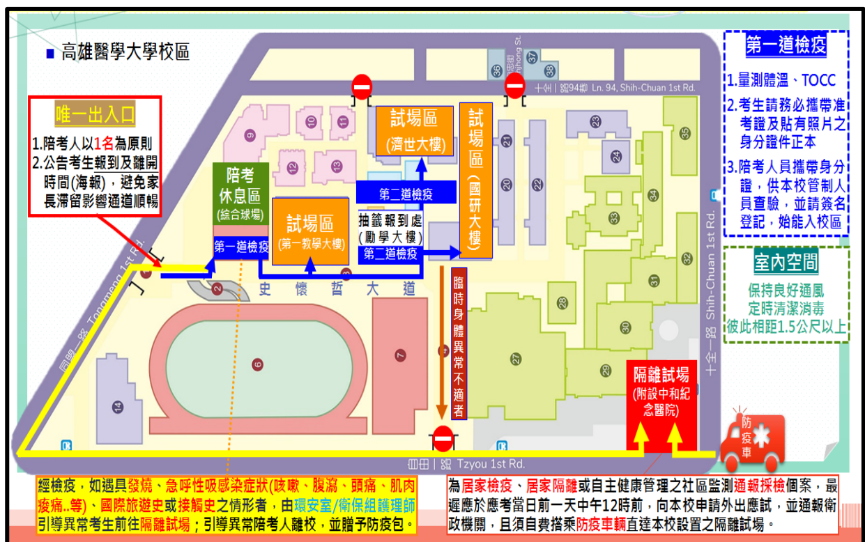
圖一：校園動線平面圖